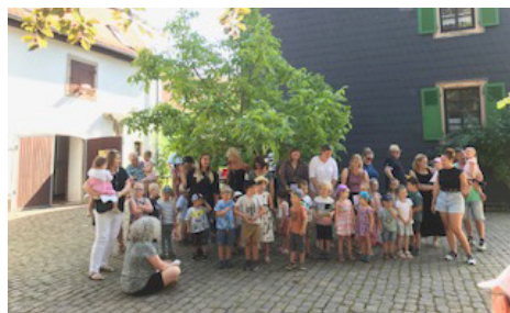
Kinder der KITA Bundenbach beim Gottesdienst des Gemeindefestes