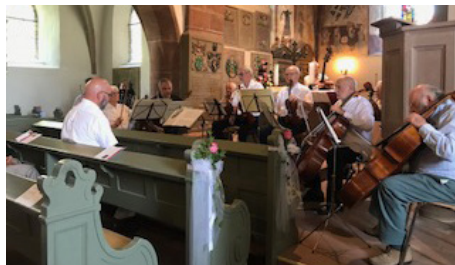
Konzert des Kammerorchesters Zweibrücken

Das Gemeindefest der prot. Kirchengemeinde Großbundenbach fand in diesem Jahr am 10. September, also am Tag des offenen Denkmals, statt. Bei schönstem Wetter kamen viele Besucher, genossen den Gottesdienst, das Essen, den Kuchen und das Konzert des Kammerorchesters Zweibrücken. Besonders begehrt war die Hüpfburg für die Kinder.